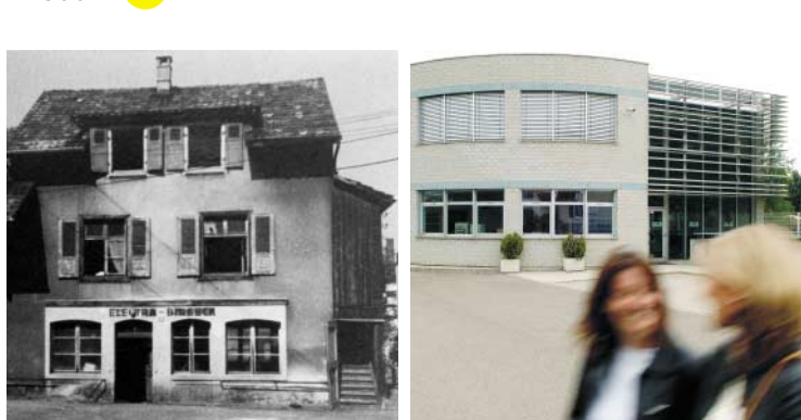
L'usine de production de chaleur et d'électricité à Birsfelden