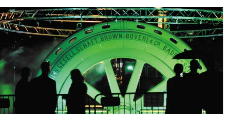
L'usine de production de chaleur et d'électricité à Birsfelden