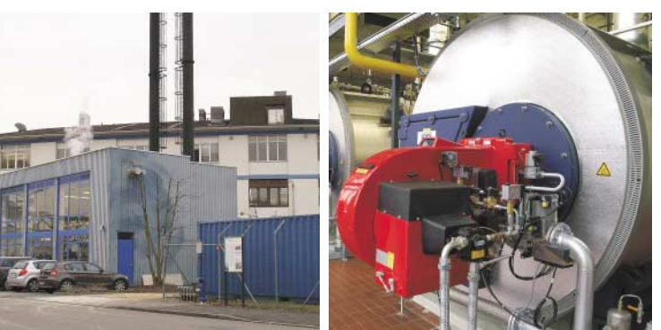
L'usine de production de chaleur et d'électricité à Birsfelden

Pour la société Legacy Pharmaceuticals Switzerland à Birsfelden, EBM construit une nouvelle centrale à vapeur destinée à l’alimentation en énergie. 👉