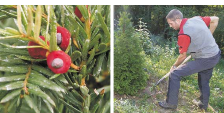
Les ifs plantés par EBM à Reinach

Sur recommandation des gardes forestiers régionaux, EBM fait planter 49 ifs dans sept communes. Lif est une espèce d’arbre menacée qui peut toutefois atteindre un grand âge. Pour éviter que les arbres ne soient rongés par les cervidés, les gardes forestiers protègent les plants au moyen d’un panier grillagé. Des spécialistes se sont engagés à s’occuper des arbres pendant une dizaine d’années. 👉