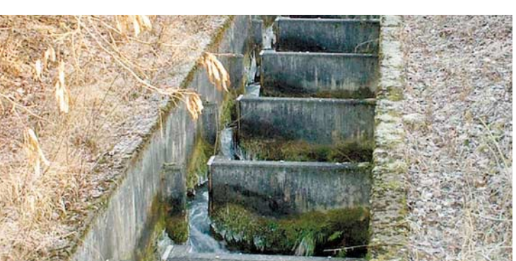
La passe à poissons de la centrale de Birsfelden

S’appuyant sur la concession des chutes de Laufon, l’inspection des services de pêche de Bâle a demandé à la petite centrale hydraulique Birseck AG d’équiper la passe à poissons d’un système de comptage permettant de surveiller son efficacité. La saisie statistique des migrations des poissons est réalisée par la section régionale de la FIPAL (Fédération des pêcheurs amateurs du lac Léman). Le long de la Birse, des passes à poissons ont également été installées. 👉