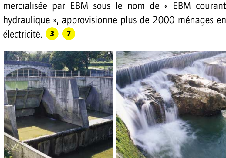
L'usine de production de chaleur et d'électricité à Birsfelden

Construction des centrales hydrauliques Domachbrugg et Laufon sur la Birse. Auparavant, les exploitations industrielles de la région avaient utilisé l’énergie hydraulique de la Birse pendant des décennies avant d’être fermées ou transférées. Résultat : la rivière resta longtemps inexploitée. Il aura encore fallu de nombreuses années pour persuader même les plus sceptiques des atouts d’une production écologique de courant. Entre-temps, les deux centrales de respectivement 1,5 MW et 0,75 MW ont été mises en service. EBM organise des visites guidées pour les groupes intéressés, à partir de dix personnes. Contact : Tél. +41 (0)61 415 43 90. L’électricité hydraulique produite sur ces deux sites, commercialisée par EBM sous le nom de « EBM courant hydraulique », approvisionne plus de 2000 ménages en électricité. 👉 👉