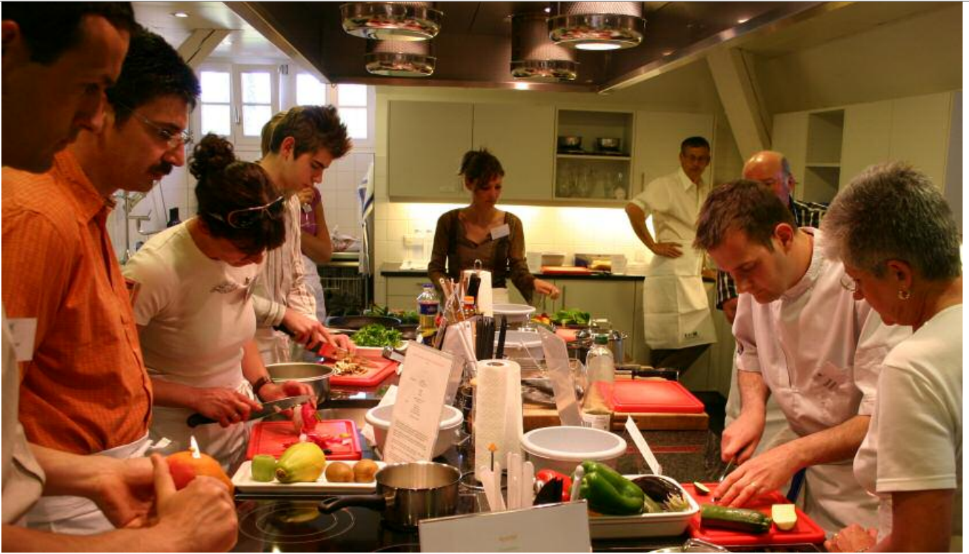
Two progressive subways tastes five silly televisi

Pour toute participation, il est demandé de réserver 15 jours avant la séance, auprès de Valérie Studer, au 03 89 89 76 43.